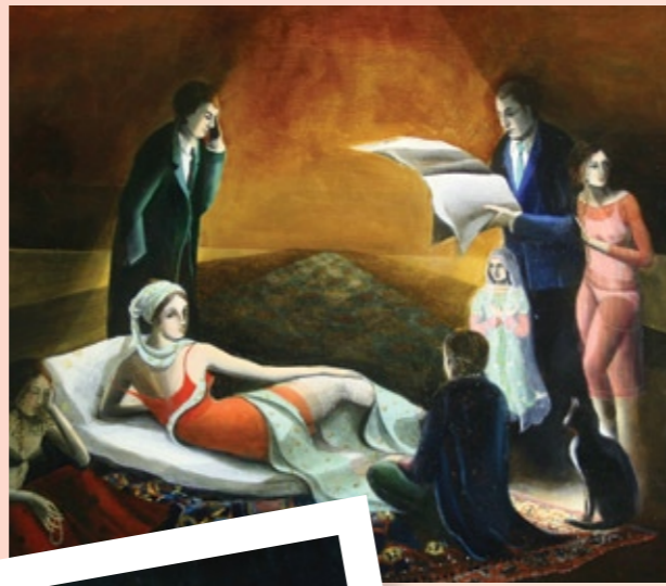
Dealing with Myths and Facts

Edvardas malerier fremstår som kulisser for multiple scener som utspiller seg både i kjente historiske rom og i vår samtid. Selve tolkningen av scenene har derfor et universelt eller tidløst preg. Malerens stadige søken etter