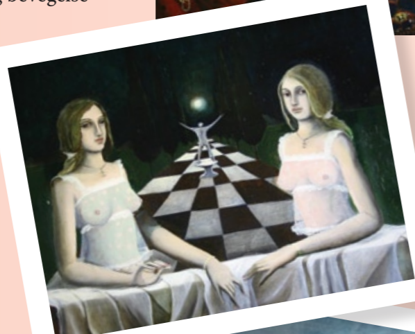
The Beatice Sisters