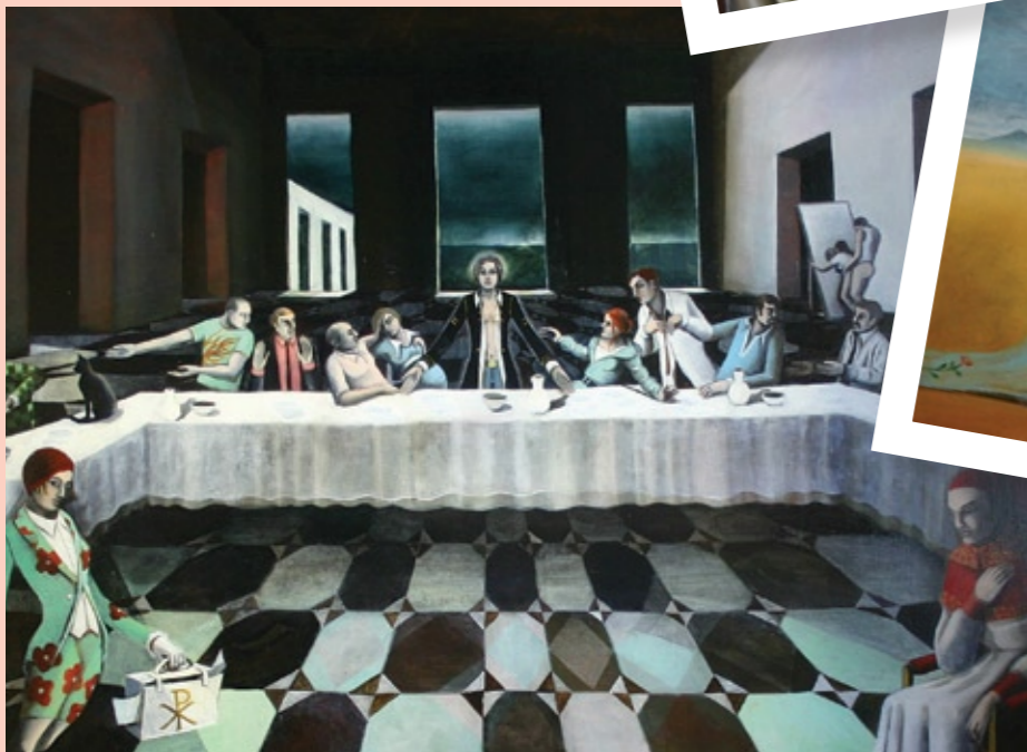
What Would Jesus Do?